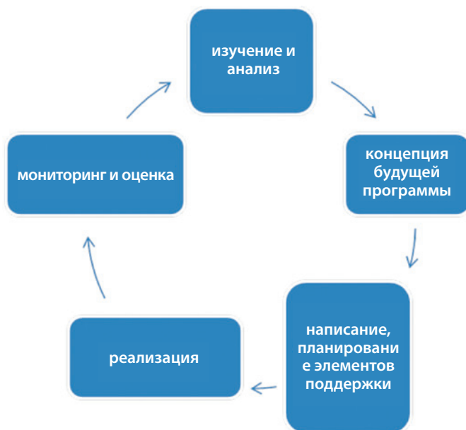
Рис. 1. Этапы разработки и пересмотра учебных программ

В последние годы международные организации, отвечая на растущий интерес к данной теме и поддержку со стороны государств-членов, содействовали разработке соответствующих рамочных документов. Руководство для педагогов «Воспитание глобальной гражданственности: темы и цели обучения», выпущенное ЮНЕСКО в 2015 г., предлагает базу для определения целей образования в духе глобальной гражданственности, задач обучения и компетенций, а также приоритетов для оценки и анализа обучения. В мае 2015 г. министры иностранных дел европейских стран призвали к принятию основных компонентов подготовленной Советом Европы новой рамочной системы компетенций для осуществления демократической гражданственности 8 . БДИПЧ ОБСЕ в 2012 г. разработало компетенции учащегося как часть более общего руководства в помощь планированию, реализации и оценке образования в области прав человека в средней школе 9 .